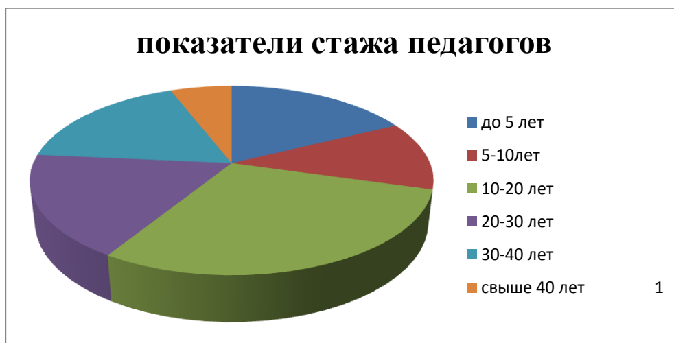
Диаграмма «Стаж педагогических работников»

Курсы повышения квалификации в 2020 году прошли 6 педагогов Детского сада.